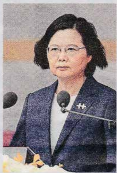
President Tsai Ing-wen.

Beijing ■ China heeft laaiend gereageerd op een toespraak van de president van Taiwan, een land dat door het communistische regime als afvallige provincie wordt beschouwd. Volgens de machthebbers in Beijing zoekt Taiwan de confrontatie. Ook zou president Tsai Ing-wen de feiten verdraaien. De Chinese leiding reageerde op de aankondiging van Tsai om de defensie van het land verder te versterken, gezien de jongste ontwikkelingen met China. Ze sprak op de nationale feestdag van Taiwan, een eiland voor de Chinese kust. Taiwan werd in 1949 gesticht.