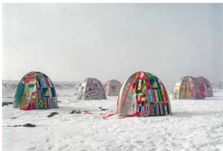
Lucy en Jorge Orta, Antarctic Village – No Borders , installatie van 50 tenten, bestikt met landenvlaggen, kledingstukken, linten, zeefdruk, maart-april 2007. © Lucy Orta en Jorge Orta