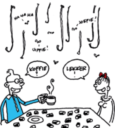
Illustratie Pieter van Oostveen

63 BUSJES VAN FOTOROLLETJES ZIJN IDEEAAL VOOR: 1 KILO KOFFIE EN 63 MILIEU-VRIENDELIJKE VLIEGENVANGERS!