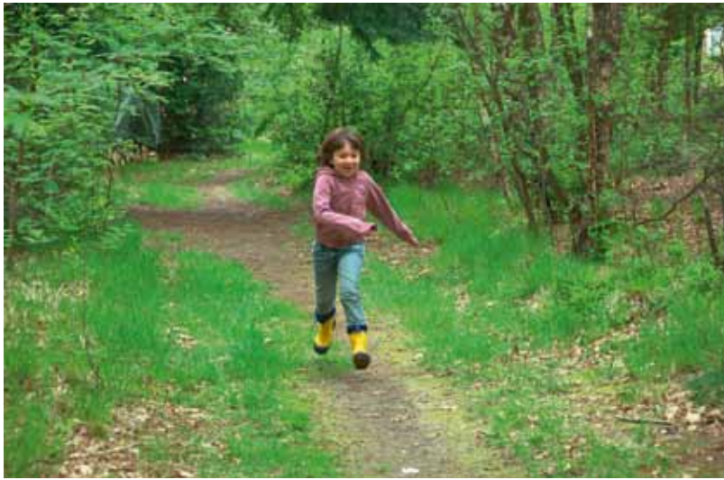
De laan op het terrein. Ook kinderen hebben het er naar hun zin