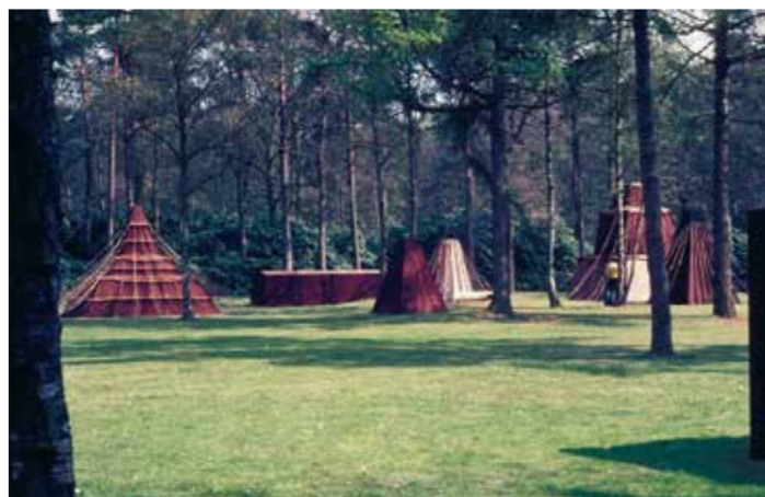
Cornelius Rogge, Tentenproject, 1975, canvas, staal en touw, collectie Krölller-Müller Museum