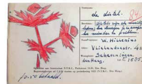
Registratie 'De Distel', W. Hillenius, 1950