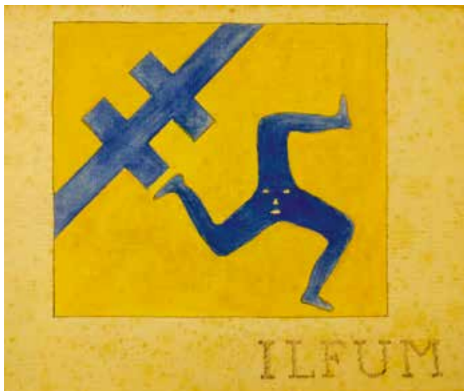
Ontwerp 'Altijd in beweging' (tentnaam Ilfum), de heer en mevrouw Carl Denig, 1922