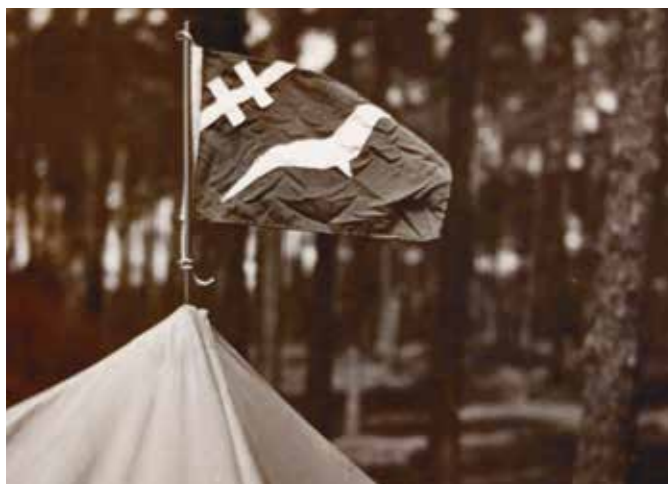
Tent met vlag, J.F. Roest, 'Zwervende meeuw', 1939

er namelijk in Rotterdam en Den Haag geroepen als een stelletje flink in lengte verschilde.