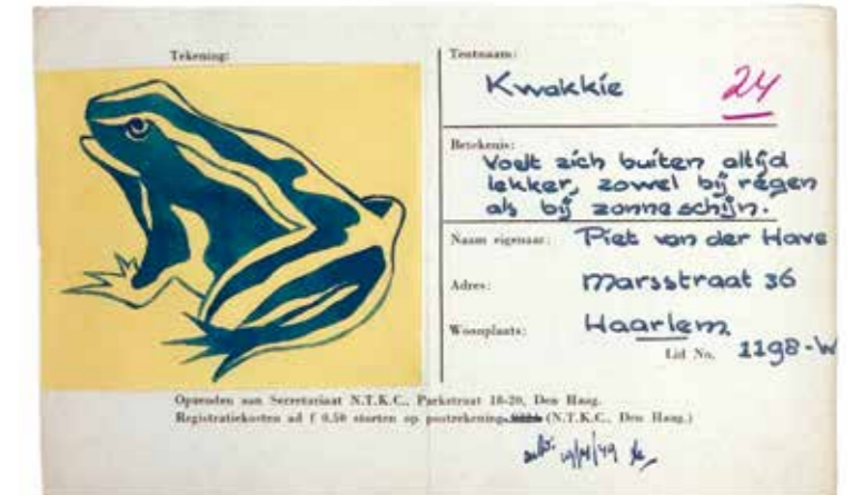
Registratie 'Kwakkie', Piet van der Have, 1949

Tot in de jaren '50 verschenen in het clubblad regelmatig stimulerende oproepen om een huisvlag te maken en te laten registreren. Echt een 'werkje voor de wintermaanden', en tijdens georganiseerde kampen bleek steeds weer 'van welk nut een huisvlag kan zijn'. Ook werd de tip gegeven om je beeldmerk niet op de vlag te naaien, maar met behulp van een sjabloon te verven, anders werd de vlag te zwaar om goed te kunnen wapperen. Lijsten met geregistreerde huisvlaggen werden aanvankelijk gepubliceerd in gidsjes met kampeerplaatsen, een handzaam