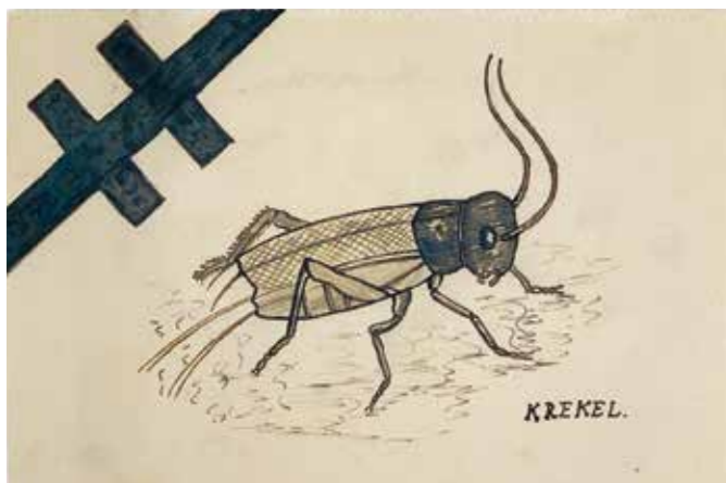
Ontwerp 'Krekel', G.J. Vree, 1933