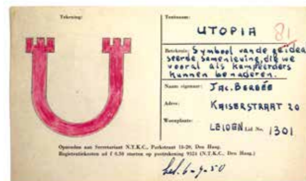
Registratie 'Utopia', Jac. Berbée, 1950

Een bijzondere subcategorie vormen de vlaggen die de tent met een burcht, een kasteel of een paleis associëren. W.C.J. de Koning (jaren '30) noemde zijn of haar tent met een toespeling op zijn naam 'Het Paleis' en voerde een vlag met een kroon. J. Bardet