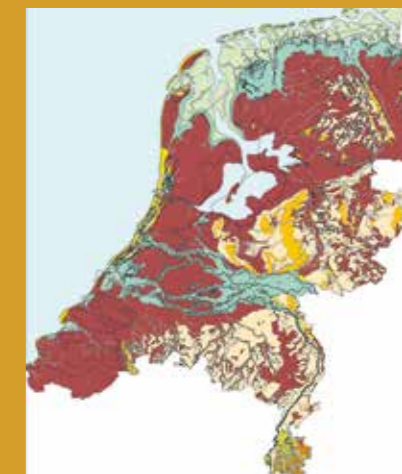
Nederland in 100 na Chr. Op de plek van de Roggebot waren toen zandgronden, de latere zandbanken.